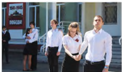
Театральная постановка от старшеклассников.