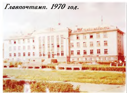
Главпочтамп. 1970 год.