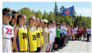
Открытие юбилейной легкоатлетической эстафеты, приуроченной к празднованию Дня Великой Победы.