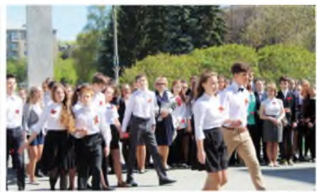
Майский вальс от седьмой параллели.