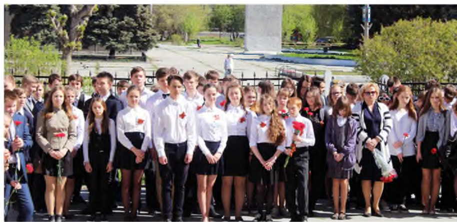
В преддверии празднования Дня Великой Победы в лицее №39 прошла торжественная линейка.

Под мирным небом, в ласковых лучах майского солнца вальсировали пары.