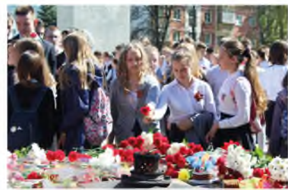
Возложение цветов к Вечному огню.